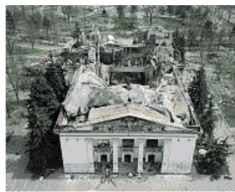
Pianista In alto il pianista ucraino Alexander Romanovsky noto per le sue posizioni filo russe. Qui accanto le rovine del teatro di Mariupol davanti a cui Romanovsky si è esibito

usato dall'inizio del conflitto quale rifugio antiaereo: nonostante ciò il pianista non esitò ad accompagnare Lundstrom nella sonata numero 21 per violino di Mozart, il tutto immortalato in un video che venne prontamente diffuso sui social dai propagandisti russi.