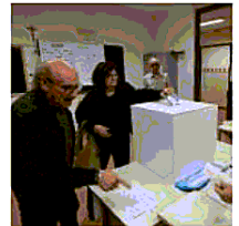
Votazioni per la fusione

• La legge - precisa l'assessore Calzavara - dà la possibilità di intervenire con la maggioranza di «sì»