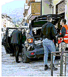
INDAGINI Gli ultimi accertamenti effettuati martedì scorso

La strage di Mestre Bus, tre quesiti e 120 giorni di tempo per il super esperto