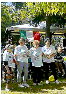
Gli anziani premiati

Non capita certo tutti i giorni agli ospiti di una residenza per anziani di sparare con una pistola d'acqua agli operatori. E magari, se si è fatto centro, di ricevere pure una coppa, una medaglia o, se la mira non è stata infallibile, almeno un bel premio di consolazione. Ebbene, tutto questo è accaduto alle Olimpiadi della Terza Età che, nei giorni scorsi, hanno visto vent'anziani dell'esp "A. Baldassini" di Gualdo Tadino e altrettanti di "Villa Salmata" di Nocera Umbra, darsi battaglia in due giorni di "sfide atletiche" dove, sotto l'attenta osservazione degli operatori e delle operatrici, hanno messo alla prova le