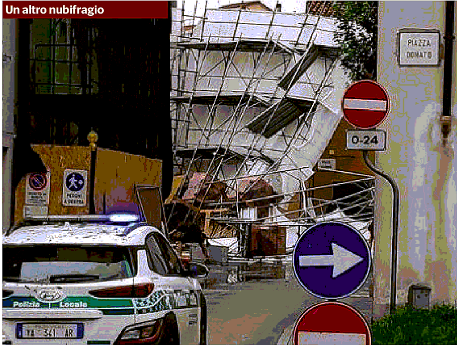
Verolanuova Il forte vento ha provocato disagi anche nel cuore della Bassa, ma anche nell'Hinterland dove il Comune più colpito è stato Mazzano