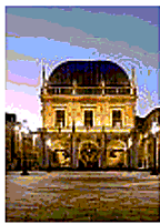
Stop Al percorso