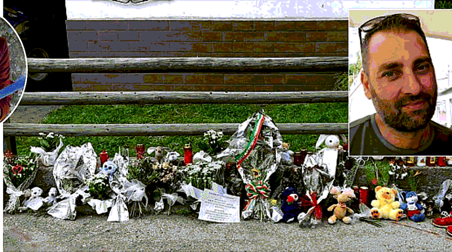
Santo Stefano di Cadore Fiori e giocattoli depositati dalla gente sul ciglio di via Udine, nel punto in cui sono state investite e uccise tre persone