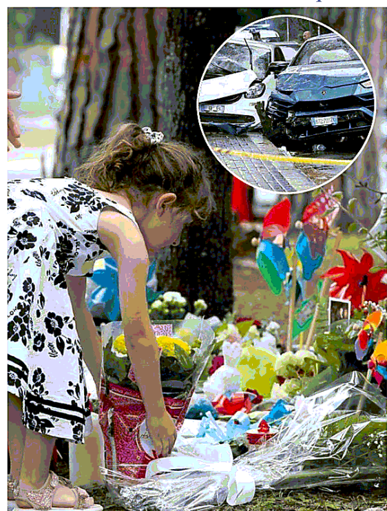
Una bimba deposita un mazzo di fiori sul luogo dell'incidente a Casal Palocco

La morte di Manuel Choc e rabbia nel quartiere