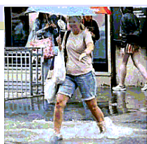
L'acqua "alta" a Roma

duti. «Benvenuti a Venezia», scrive qualcuno postando le foto della "laguna" di Ponte Milvio con lo sfondo della torretta allagata e i topi che sguazzano nell'acqua, ed ecco a voi le cascate della stazione Termini. A Settebagni i bambini di un summer camp sono stati riaccompagnati a casa con la barca, tipo Miami. Mentre a Cortina d'Ampezzo le onde erano così alte che neanche a Fregene. «Saluti dal lago Annibaliano», scrive un bagnante. Mentre le strade attorno al Colosseo si so-