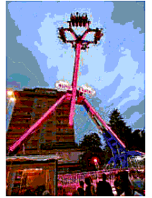
Il luna park di Thiene

Il parco di divertimenti porterà con sé, da oggi a domenica 25 giugno, una modifica temporanea della sosta in questa zona di Thiene: sarà chiuso al transito e alla sosta delle auto il tratto di piazzale Divisione Acqui che confina con via Damiano Chiesa nonché tutto il parcheggio pubblico del Bosco dei Preti. Sarà inoltre istituito il divieto di transito, eccetto residenti, e di sosta in via Damiano Chiesa. In questo periodo gli automobilisti potranno lasciare l'auto in sosta nei parcheggi dell'ex Nordera, della biblioteca, dell'istituto Ceccato in via Vanzetti, del parcheggio di via Carlo del Prete. Gli sportivi potranno contare anche quest'anno sulla San Giovanni race, corsa podistica