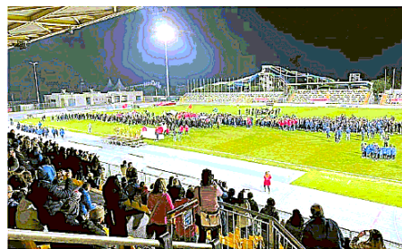
Le squadre schierate sul prato dello stadio Teghil a Lignano

olandese Euro-Sportring. Austria, Francia, Germania, Svizzera e Italia le nazioni di provenienza dei giovani giocatori delle categorie, Primi calci, Pulcini, Esordienti, Giovanissimi e Allievi impegnati sui campi di Lignano. Prencico e Teor. L'evento ha ricevuto il patrocinio dell'amministrazione comunale di Lignano che attraverso l'assessorato allo Sport ha fornito