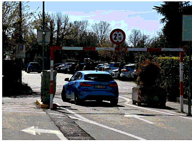
Lazise L'ingresso del parcheggio La Marra