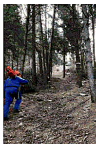
Un cacciatore ripulisce un sentiero

lino-Costa Mezzana, il sentiero Casà-Casarole, quello che porta al Balot tacà via, il vecchio sentiero delle Pegre, quello dei Monti e, infine, il sentiero Seale-Buse-Valoara. Alcuni di questi», ha proseguito Castori, «hanno richiesto uno sforzo veramente notevole con il lavoro di diversi uomini armati di motoseghe, rastrelli, falci e accette. Il sentiero di Valvacara, ad esempio, aveva numerosi abeti divelti dalla tempesta che lo ostruivano per centinaia di metri. Il sentiero che da Boccino porta a Boas e a Sant'Antonio delle Pontare è stato pulito e, a lavoro ultimato, un gruppo di escursionisti di passaggio si è complimentato con i volontari. Un