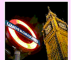
IN BILICO Il viaggio a Londra

«Mia figlia "senza" passaporto: a rischio il viaggio studio a Londra». Un imprenditore montebellunese padre di due figlie adolescenti che frequentano il Pio X di Treviso, racconta la situazione che sta vivendo da un paio di mesi sul fronte del rinnovo dei passaporti. Un caso, il suo, emblematico. Bon a pagina XIII