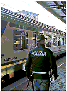
CONTROLLI In stazione a Treviso

► Treviso, due ragazze di 13 e 15 anni si pestano sul convoglio per Oderzo: la capotreno fa retromarcia e torna in stazione ► Il pestaggio ripreso con i telefonini dai coetanei presenti Autobus, arrivano le prime 15 bodycam anti aggressioni