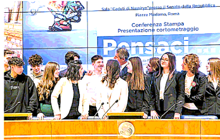
I ragazzi di Villafranca in visita al Senato per presentare il film