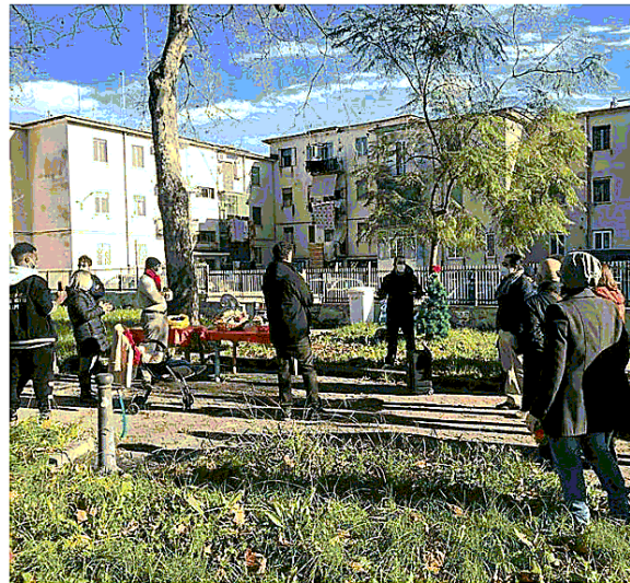
Una riunione di abitanti del rione Acquaviva