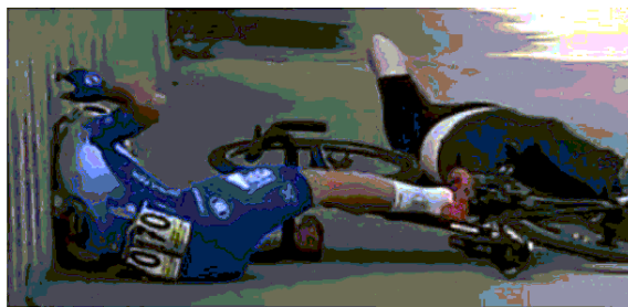
Il ciclista ha appena travolto il direttore sportivo ai bordi della strada: morto sul colpo

all'obitorio dell'Inrca). All'esame autoptico è stato presente anche il consulente di parte, nominato dallo Studio3A-Valore che tutela la famiglia del defunto, il medico legale Marco Palpacelli. Oltre 3 ore di autopsia che la Procura aveva chiesto per avere certezza che il 41enne non avesse avuto un malore e che le cause della morte fossero proprio dovute all'investimento. La bicicletta dello sportivo è