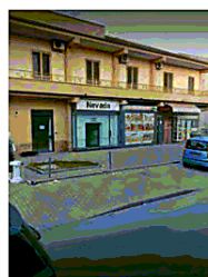
Il negozio “Nevada”