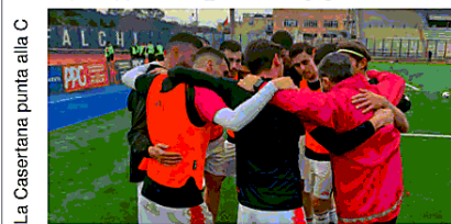
La Casertana punta alla C

Serie D Le strategie rossoblù per il doppio traguardo La Casertana su due fronti Play off e ripescaggio in C