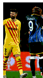
Pique e Osimhen

Altamura e Auletta alle pagine 25, 26, 27 e 28