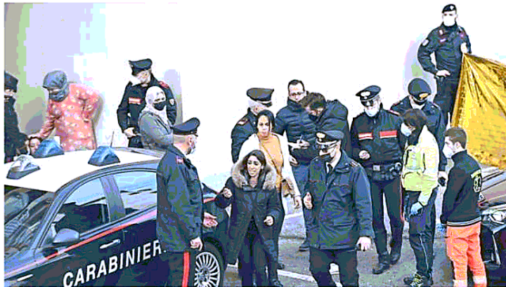
La mamma del bimbo circondata dai carabinieri

In casa al momento della tragedia si trovavano la nonna e la zia, il piccolo molto vivace e sempre in movimento, come tutti i bimbi di quell'età, ha iniziato ad avventurarsi per la casa, fino ad arrivare al divano del salotto, posizionato sotto la finestra. I vetri in quel momento erano stati aperti per arieggiare gli ambienti. Nonna e zia non si sono accorte che il piccolo, probabilmente incuriosito