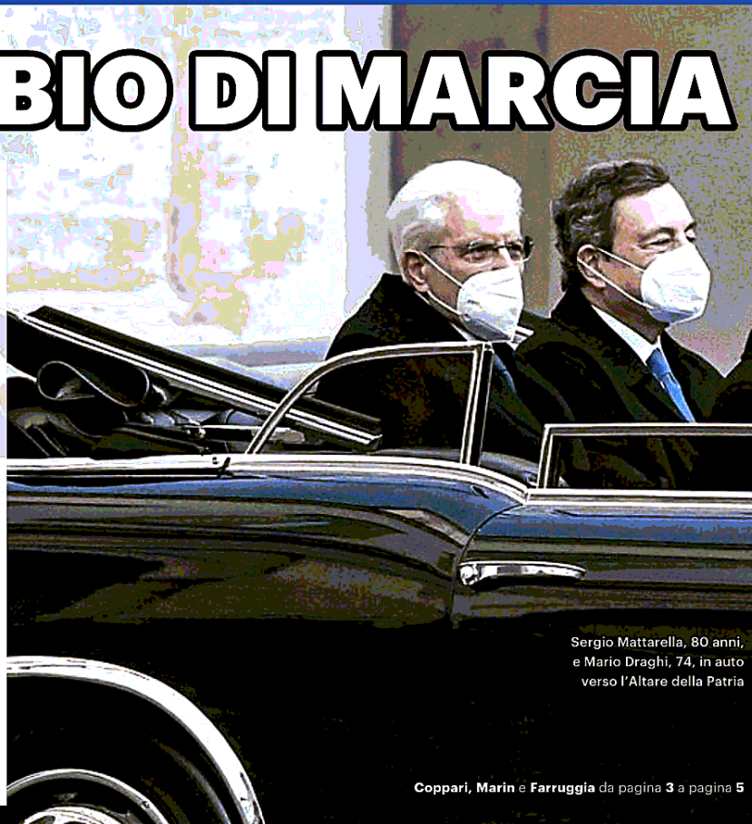
Sergio Mattarella, 80 anni, e Mario Draghi, 74, in auto verso l'Altare della Patria