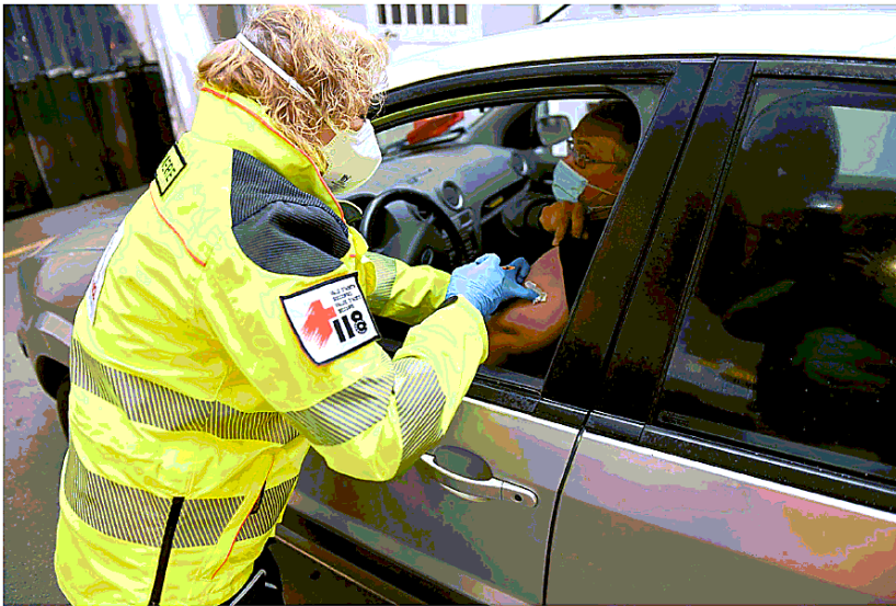
La prima serata di vaccini al drive-in secondo l'Usl è stata un successo

Teléfono: 0171 608122 Cell. 334 6797772 Fax: 0171 488249