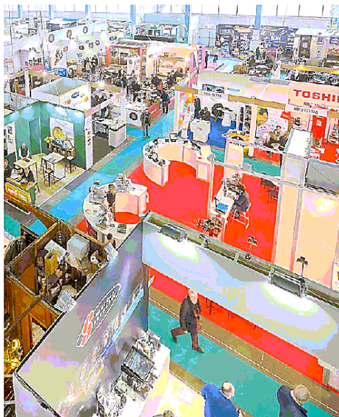
Confermata la prossima edizione della Fiera dell'Alto Adriatico

«L'appuntamento fieristico» dice «è sempre stato un punto fermo per gli imprenditori del comparto turistico, consapevoli di trovarvi professionalità ed eccellenze, oltre che momenti di incontro e confronto sulle tematiche più importanti per il nostro comparto. Riteniamo che, forse mai come in questo mo-