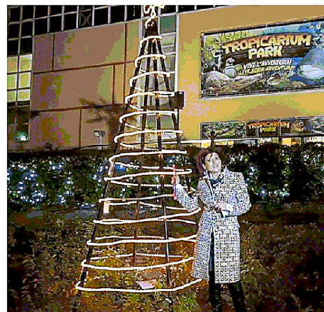
Fitto calendario di eventi per Natale a Jesolo e Cavallino

In piazza Mazzini dalle 16.30 di sabato scatterà la performance d'arte "L'Aprisogni, il castello di Tremalerra", mentre dalle 15.30 di domenica arriverà la mu-