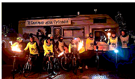
I partecipanti alla staffetta ieri hanno fatto tappa a Portogruaro